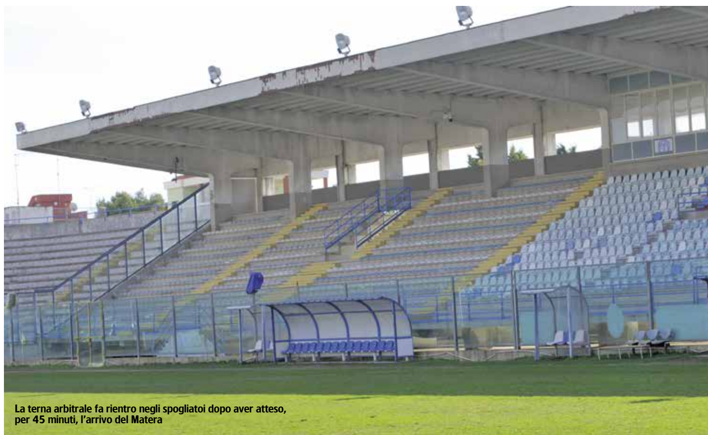
La terna arbitrale fa rientro negli spogliatoi dopo aver atteso, per 45 minuti, l'arrivo del Matera

La gara tra Virtus Francavilla Calcio e Matera non si è disputata per assenza della formazione lucana. Viene assegnata la vittoria a tavolino per 3-0