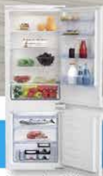
Frigo congelatore 285 lt