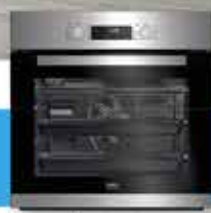
Forno multifunzione inox