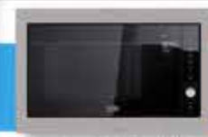
Microonde e Grill 5 Livelli di Potenza