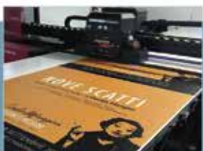
stampa diretta UV