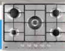
Piano cottura da 75 con 5 fuochi