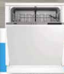
Lavastoviglie 12 coperti